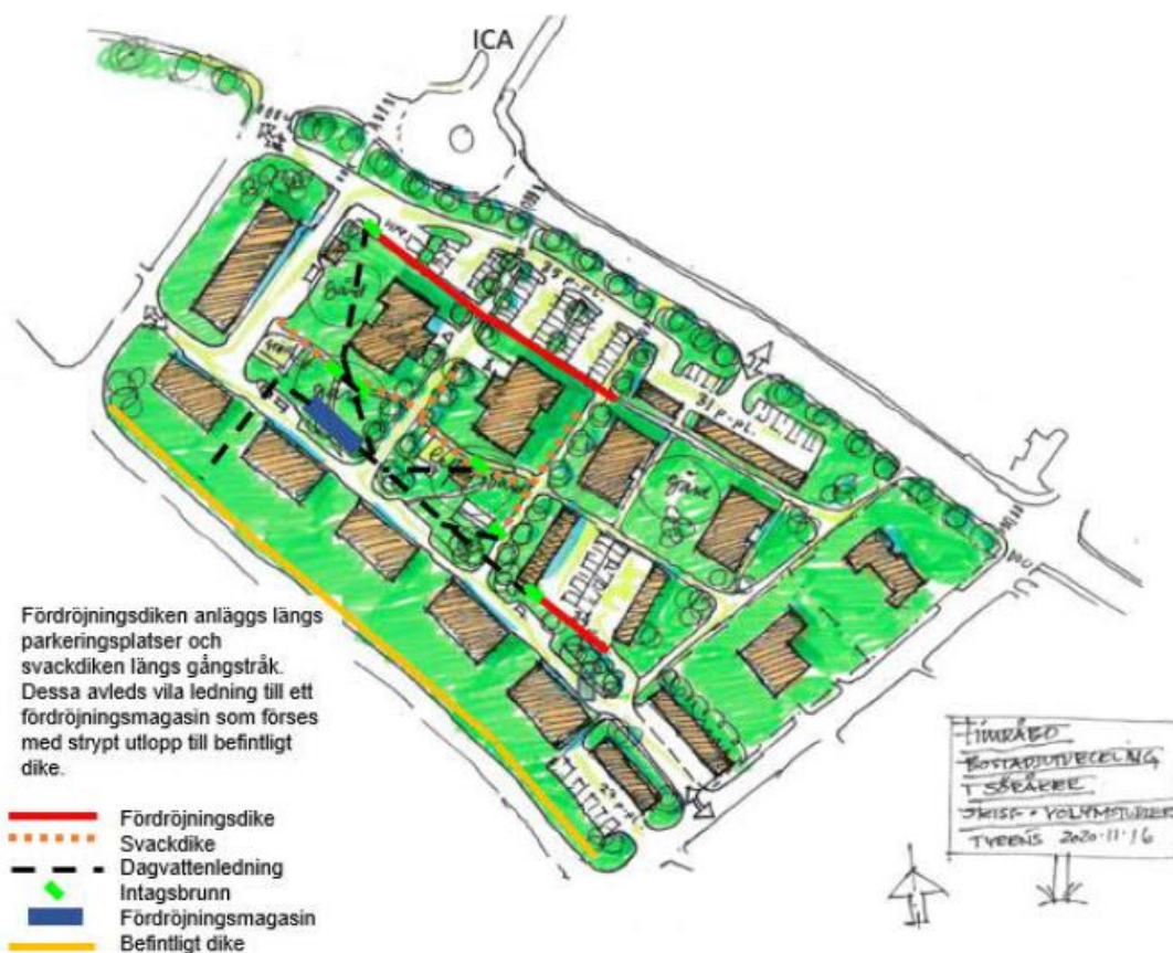
Figur 5. Systemlösning för LOD.

Rening via översilning bedöms vara tillräckligt. Totalt krävs en magasinvolym på ca 115 m 3 för att fördröja 10-årsregnet från hela detaljplanområdet. Vid ett 100-årsregn kommer fördröjningsanläggningar för dagvatten och ledningar vara underdimensionerade och vatten rinner längst med vägar. Föroreningshalter samt -mängder beräknas öka för nästan samtliga ämnen efter exploatering. Dock föreligger det goda chanser att uppnå den procentuella reningseffekten för att komma ner i dagens föroreningshalter, om rening i anläggningar tillämpas, eftersom dagvattnet passerar antingen översilningsyta eller krossdike/makadamdike. MKN för recipienten bedöms inte påverkas av plangenomförandet då 90 % av den totala årsnederbörden utgörs av regn upp till 20 mm. Detta beror på att majoriteten av alla regn som inträffar har en liten regnvolym, dvs. det inträffar fler mindre regn än stora under ett år. Eftersom dagvattenreningen dimensioneras för dessa regn, resulterar det i att 90 % av den totala regnvolymen under året genomgår någon form av rening. För mer om dagvattenhantering se bilaga Dagvatten rapport .