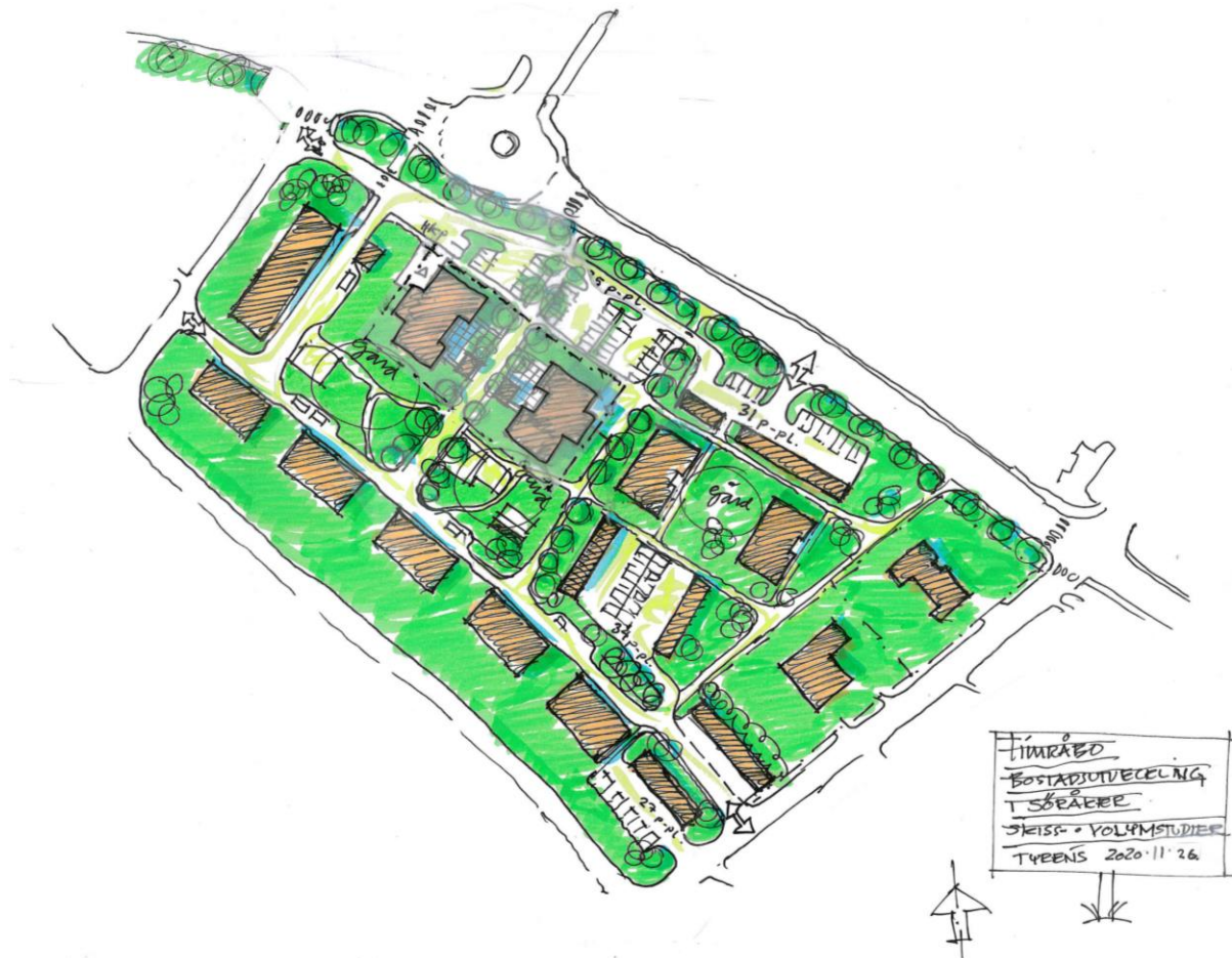
Figur 1. Visionskiss över planområdet, Tyréns 2020-11-26.