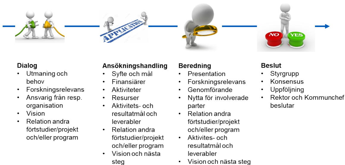
Figur 1. Formell beslutsprocess för forskningsmedel.