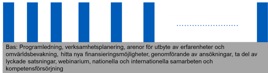
Figur 2. Generell struktur för program.

Finansieras genom en grundfinansiering från samverkansavtal. Insats kopplat till budgetomfattning på samverkansavtal