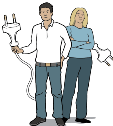
Figur 2. TiB. Illustration MSB