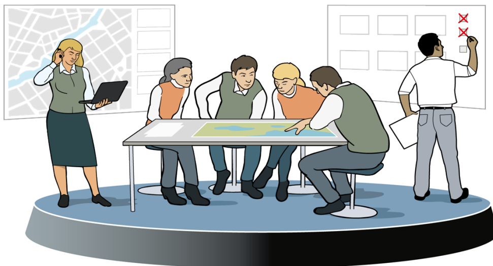
Figur 4. Stöd till inriktning- samordningsfunktion. Illustration MSB

Funktionen är skalbar och dess storlek ska styras av aktuellt behov. En person kan utföra flera funktioner eller så kan flera personer behövas för att dela på uppgifterna. Funktionens grundbemanning utgörs primärt av personal från kommunledningskontoret på Timrå kommun. Funktionen ska dock kunna kompletteras och bemannas av personal från förvaltningar, bolag och förbund samt externa aktörer utifrån exempelvis specifik expertkunskap eller behov i övrigt i syfte att säkerställa aktörsgemensam hantering.