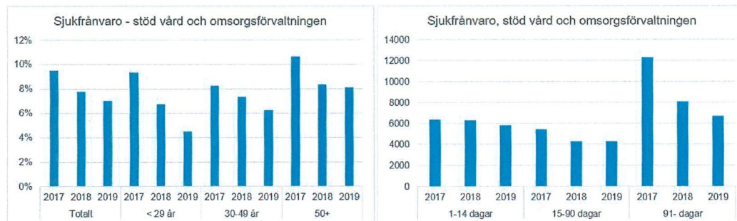
Figur 2: Sjukfrånvaro stöd, vård och omsorgsförvaltningen.

Sjukfrånvaron inom Timrå kommun har totalt sett minskat sedan 2017. Sjukfrånvaron har minskat som mest inom bland de anställda som är 29 år eller yngre. Totalt sett har sjukfrånvaron minskat och uppgår per november 2019 till 7 procent (9,5 procent 2017). Långtidsfrånvaron (91- dagar eller fler) har minskat kraftigt sedan 2017. Kortidsfrånvarodagarna har minskat något mellan 2017 och november 2019.