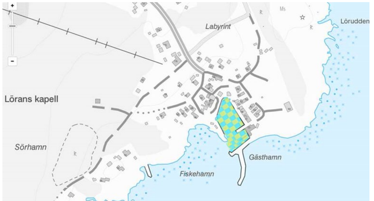
Figur 5. Lörans hamn med hamnområde mellan kajanläggning/strand och markerad gräns.