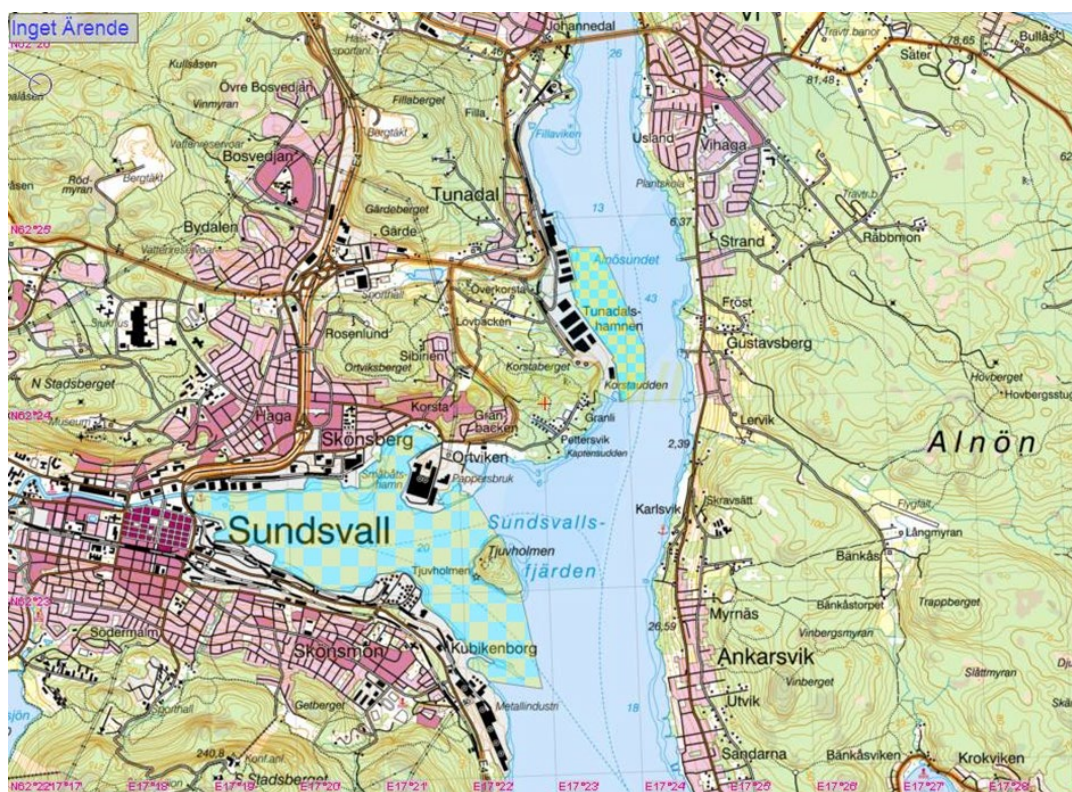
Figur 3. Sundsvall och Tunadals hamnområden.