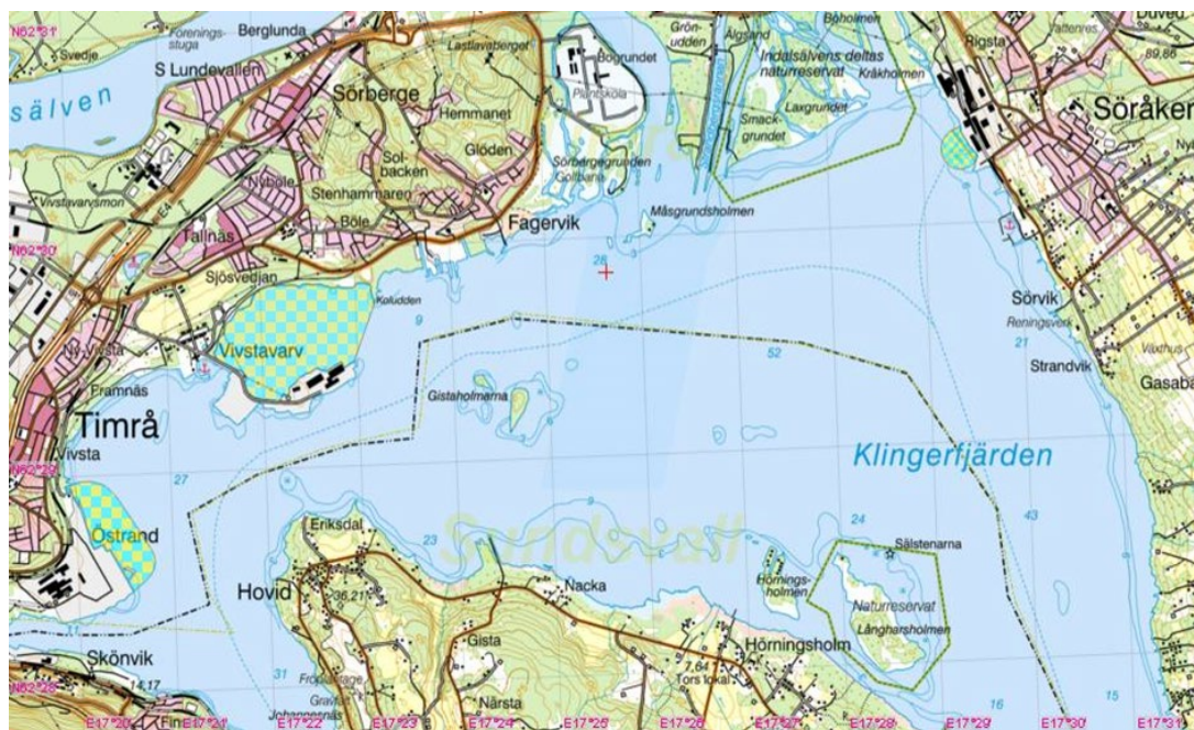
Figur 4. Östrand, Wifstavarv och Söråkers hamnområden.