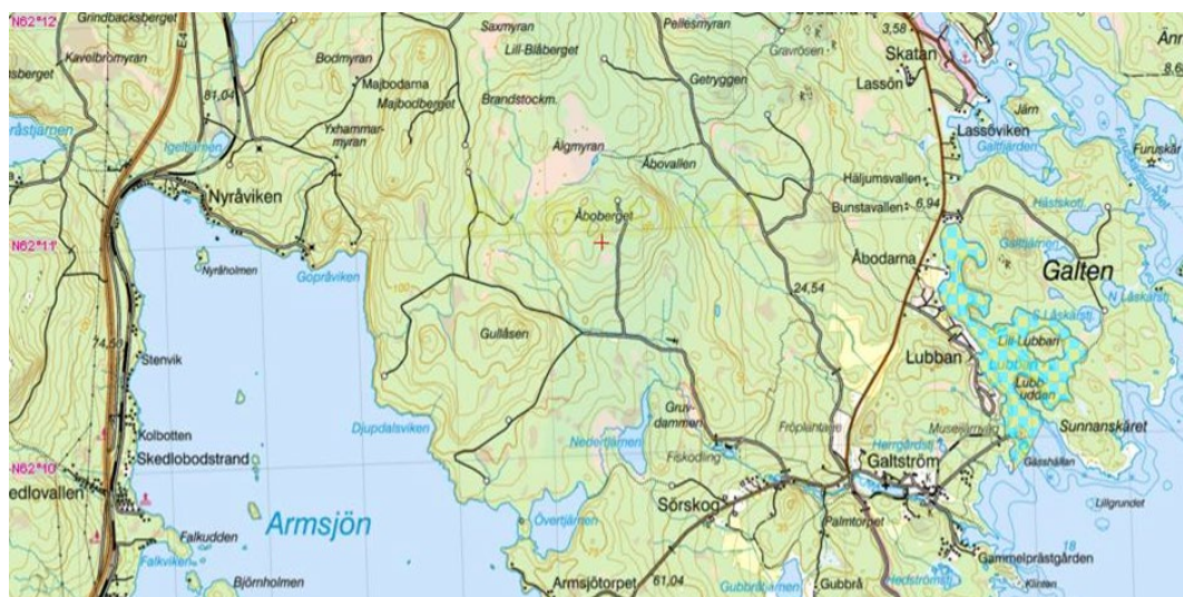
Figur 1. Galtströms hamnområde.

Staten ansvarar inom Sveriges sjöterritorium och Sveriges ekonomiska zon via Sjöfartsverket för Sjöräddningstjänst (livräddning) och via Kustbevakningen för miljöräddningstjänst till sjöss. I övriga insjöar, vattendrag, kanaler och hamnar inom medlemskommunerna har MRF motsvarande ansvar. Nedan visas (figur 18 - figur 22) de vattenområden kring hamnar där MRF har ansvar för liv- och miljöräddning (rutat område).