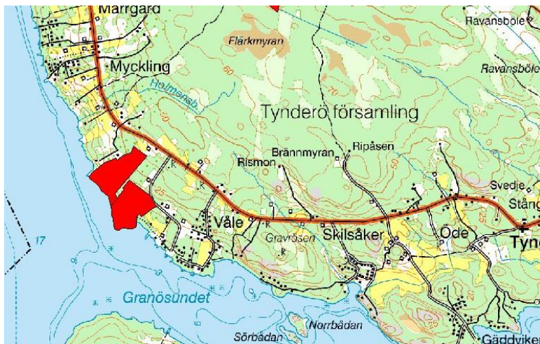
© Lantmäteriet, 2004. Ur GSD-terrängkartan ärende 106-2004/188-Y

Läs mer i Naturvårdsverkets handbok om Natura 2000.