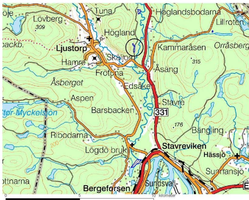
Översiktskarta för Natura 2000-området Guldnäsbäcken .

Läs mer i Naturvårdsverkets handbok om Natura 2000.