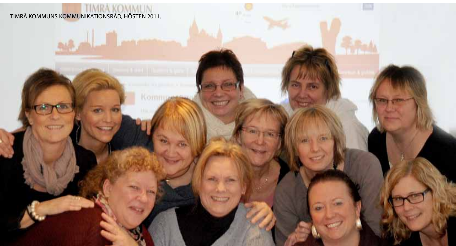
TIMRÅ KOMMUNS KOMMUNIKATIONSRÅD, HÖSTEN 2011.

Vid krissituationer som kan lösas inom ordinarie organisation, fungerar kommunens ordinarie webborganisation. Vid större och allvarigare påfrestningar inom kommunen träder organisationen för ledning och krisinformation i kraft.