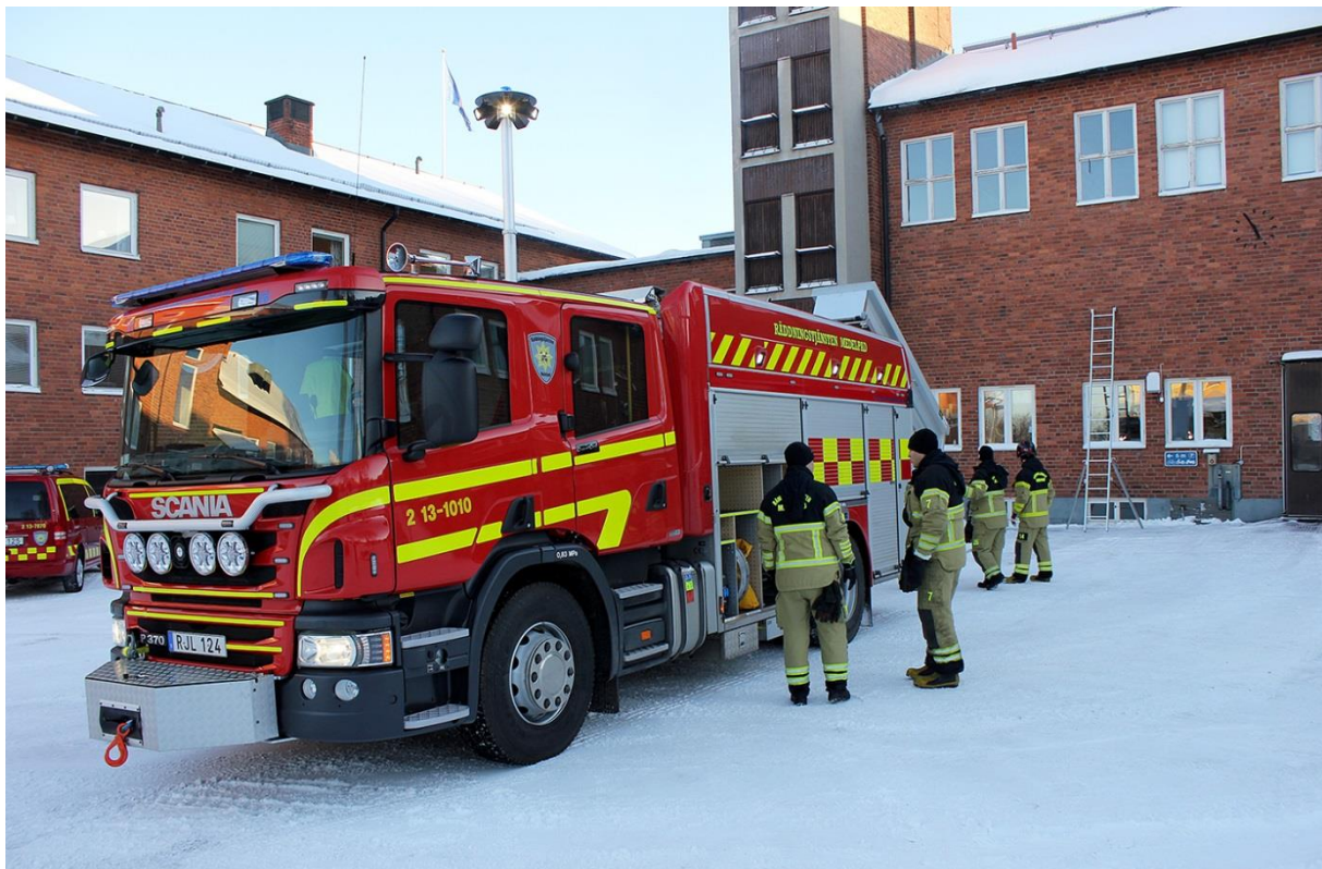
Ny basbil investerade under 2015.

MRF har inga lån för investeringar och fastigheter. Den marknadsrisk som föreligger är minskade intäkter för externa utbildningar.