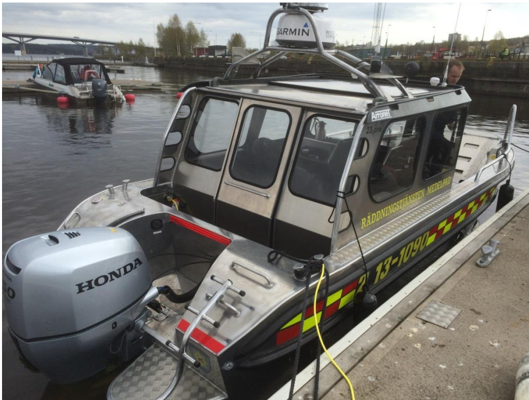
Ny arbetsbåt placerad i Sundsvalls Hamn.