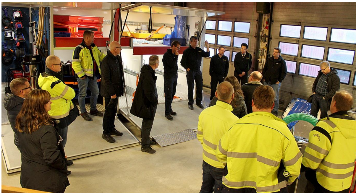
Demonstration av container för bland annat Sundsvalls kommun och Mitt Sverige Vatten.

Med stöd av MRF har Sundsvalls kommun införskaffat ytterligare en container med vattenbarriärer. MRF kommer att förvalta denna åt Sundsvalls kommun.