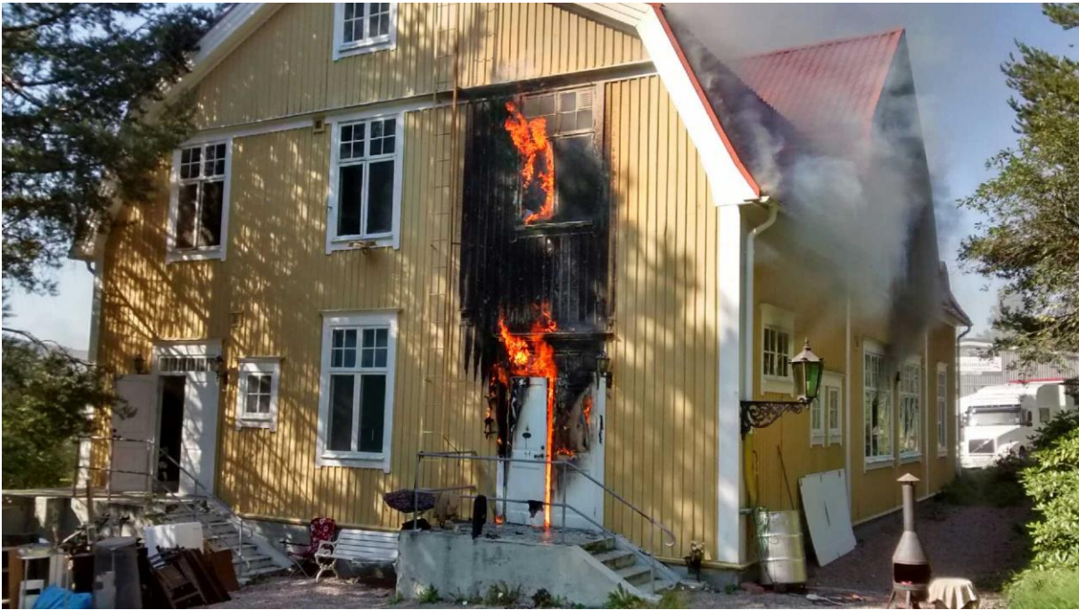
Brand på Essvik 22 augusti 2015.