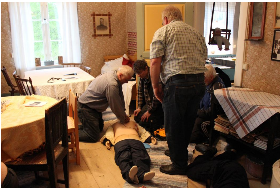
Skydd mot olyckor i glesbygd.