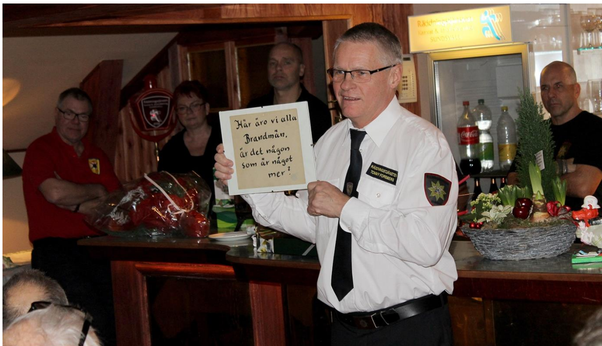
Förre förbundschefen gick i pension december 2014.

Beloppen förs som en fordran i förbundets räkenskaper och en skuld/avsättning i respektive kommuns räkenskaper.