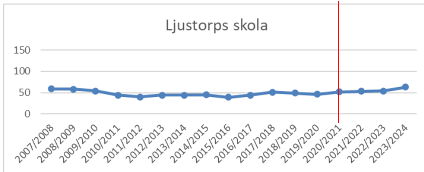
Diagram: antal elever vid Ljustorps skola år 2007-2020, med prognos 2020-2024

Vid mätningen 22 okt 2020 gick 52 elever på Ljustorps skola, se röd linje i diagrammet nedan. Det är fem färre än den prognos som gjordes den 15 maj 2019 – underlaget till lokalresursplanen.