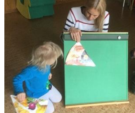
Bild: Dagens hjälprea informerar om dagens lunch.

Bergeforsens förskola har 108 barn, fördelade på tre hus och sex avdelningar/barngrupper.