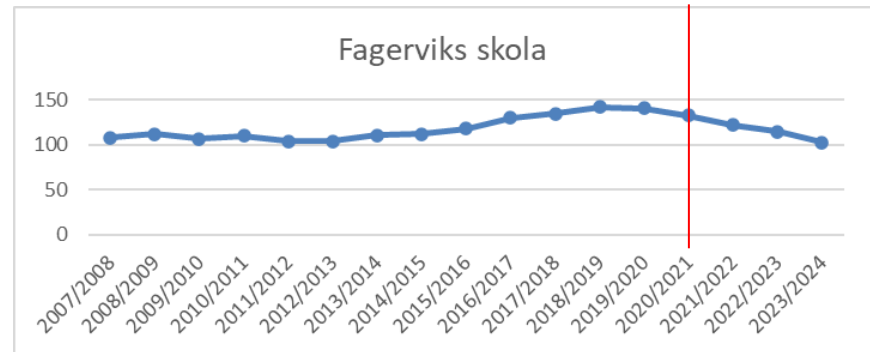
Diagram: antal elever vid Fagerviks skola år 2007-2020, med prognos 2020-2024

Vid mätningen 22 oktober 2020 gick det 133 elever på Fagerviks skola, se röd linje i diagrammet nedan. Det är 17 fler än den prognos som gjordes 15 maj 2019 - underlaget till lokalresursplanen.