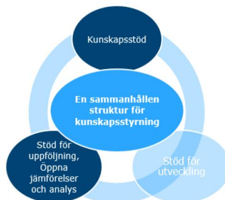
Figur 1. En sammanhållen struktur för kunskapsstyrning.

Vägledande för det som görs nationellt gemensamt är att det sker inom områden där samverkan är mer ändamålsenligt och effektivt än att varje landsting gör arbetet var för sig och att det kompletterar och stödjer det som behöver göras på regional och lokal nivå. Samverkan sker i första hand kring de två delkomponenterna kunskapsstöd och stöd till uppföljning, öppna jämförelser och analys . Andra viktiga delkomponenter för en effektiv kunskapsstyrning är stöd till utveckling och stöd till ledarskapet , vilket det bäst ges förutsättningar för lokalt.