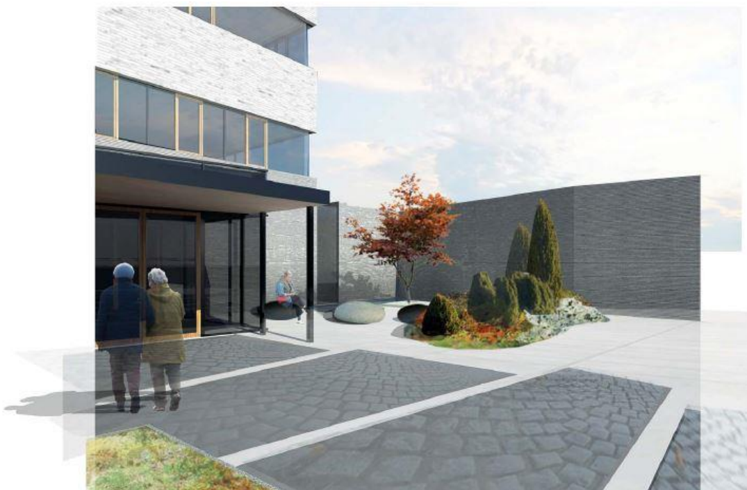
Perspektiv Utemiljö och Entré Avsked